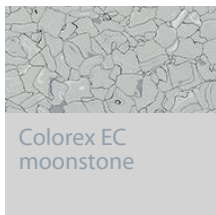
Colorex EC moonstone