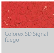
Colorex SD Signal fuego