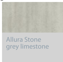
Allura Stone grey limestone