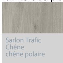
Sarlon Trafic Chêne chêne polaire