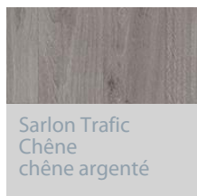
Sarlon Trafic Chêne chêne argenté