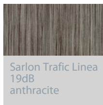
Sarlon Trafic Linea 19dB anthracite