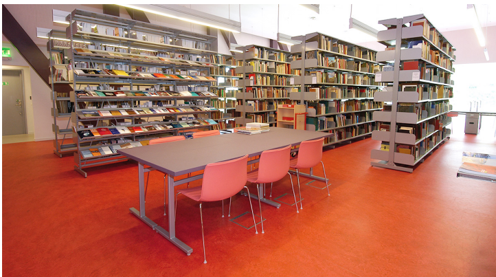
Marmoleum Fresco African desert