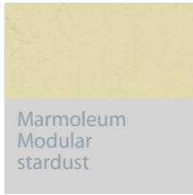
Marmoleum Modular stardust