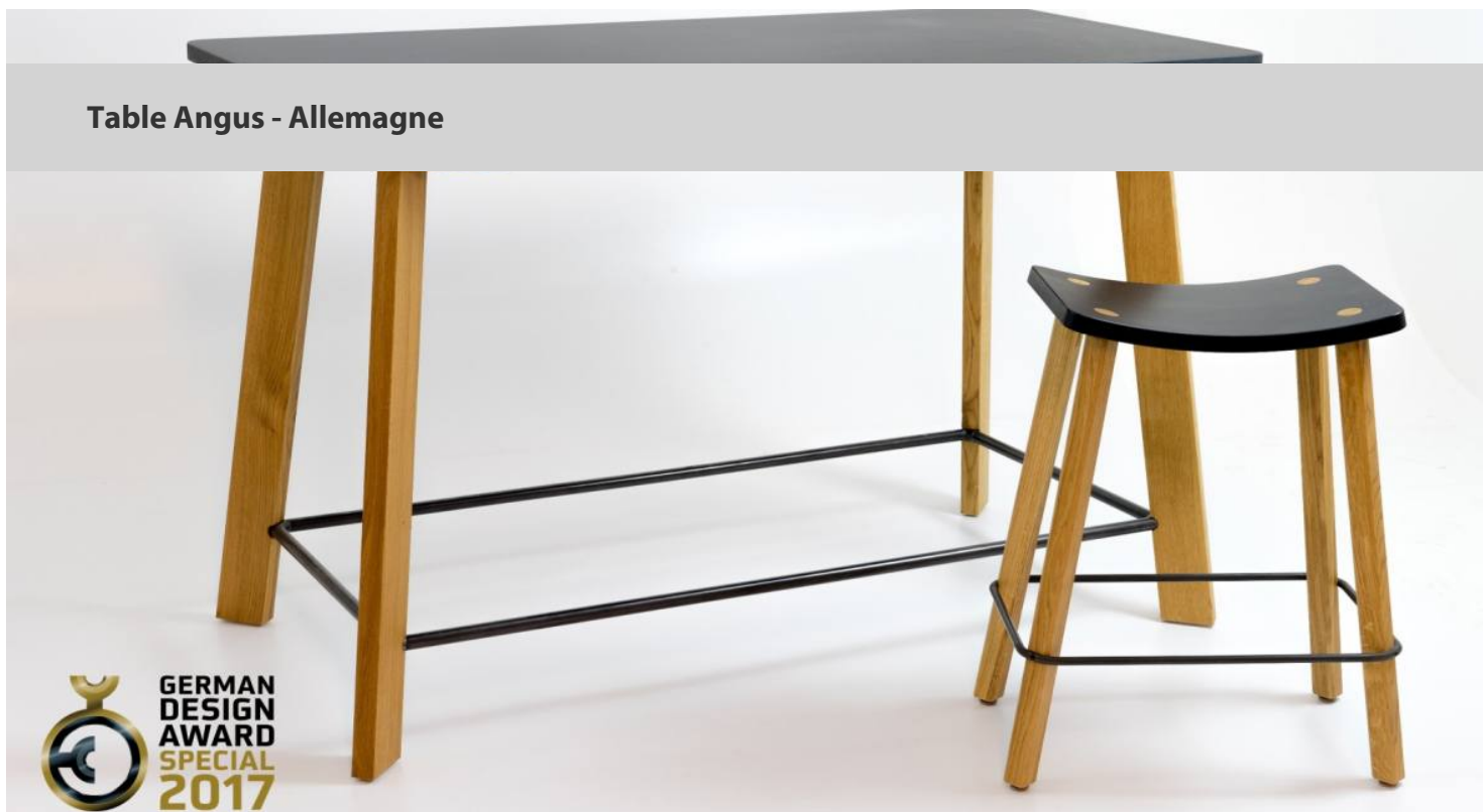
Table Angus - Allemagne

Angus est noir. Angus est une collection de tabourets et de tables de l'atelier du maître de menuisier Raphael Pozsgai. Artisanat traditionnel, matériaux durables, contemporain dans sa conception. Angus est fabriqué en petits lots à Heitersheim, au sud de Baden, au pied de la Forêt Noire. Acier dans son état original, non détartré, bois de chêne huilé, panneau de fibres de bois certifié FSC et plan de travail linoléum. La hauteur de table généreuse de 90 cm permet de s'asseoir mais aussi d'être debout. Le tableau est certifié par "German Design Award 2017 - Mention spéciale