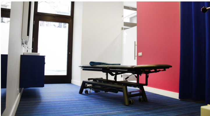
Flotex Wool Wool