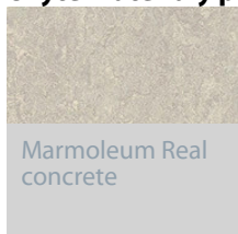
Marmoleum Real concrete