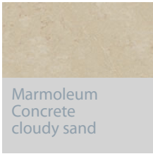
Marmoleum Concrete cloudy sand