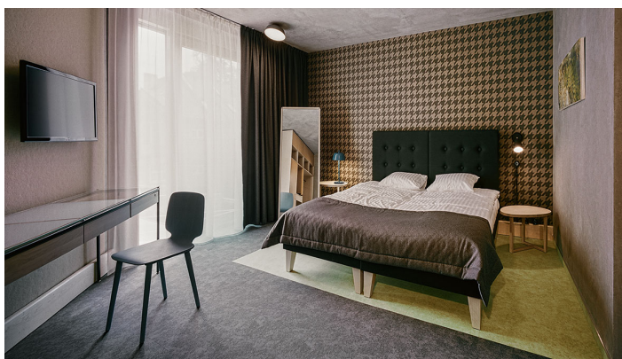
Flotex Colour płytki Calgary lime