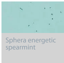
Sphera energetic spearmint