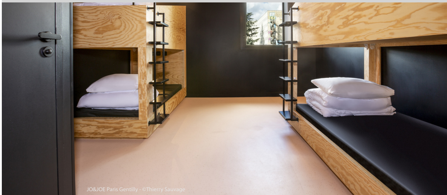
JO&JOE Paris Gentilly - ©Thierry Sauvage

JO & JOE est une Open house qui propose 3 types d'hébergement : les chambres privées, les chambres partagées et les appartements. JO & JOE ne respecte pas les règles : les lieux sont non conventionnels pour offrir aux voyageurs, à l'état d'esprit millénial, une expérience authentique. Les espaces ont été conçus de façon originale et un revêtement de sol neutre et chic a été choisi pour contraster avec le tout. Dans les chambres se trouve un revêtement de sol Sphera et dans les salles de bains, un revêtement de sol Surestep. Il existe toutefois une exception pour le couloir conçu par Penson, où la gamme de revêtements de sol modernes Flotex a été utilisée pour un rendu artistique. 7.000 m 2 sur 7 étages/9 niveaux (5740 m 2 SDP)