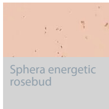
Sphera energetic rosebud