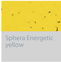
Sphera Energetic yellow