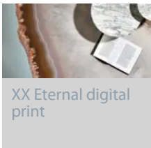
XX Eternal digital print