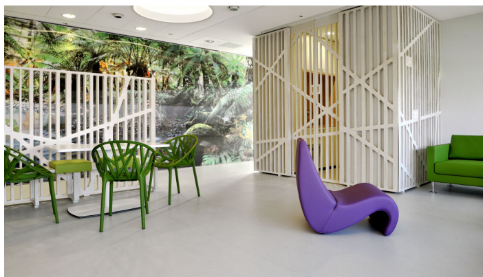
Marmoleum Fresco golden sunset