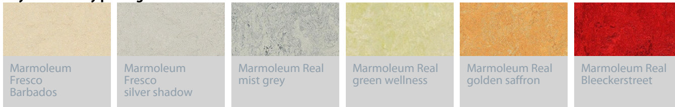
Marmoleum Fresco Barbados