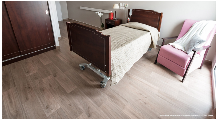
Residence Médica (3200 Avaires) - DomuV®