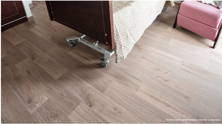
Residence Médica (3200 Avaires) - DomuV®