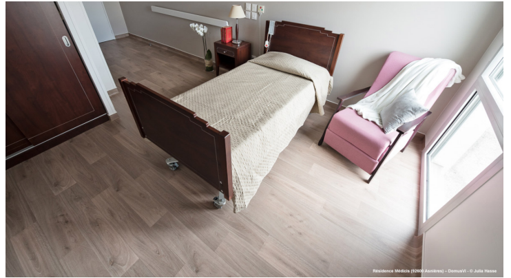
Residence Médica (3200 Avaires) - DomuV®