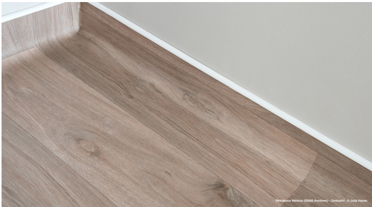
Residence Médica (3200 Avaires) - DomuV®