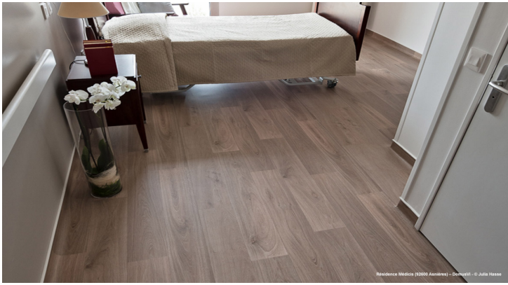
Residence Médica (3200 Avaires) - DomuV®