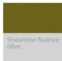
Showtime Nuance olive