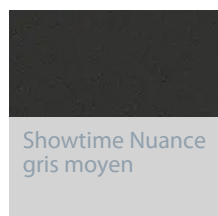
Showtime Nuance gris moyen