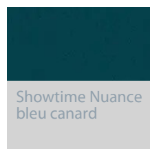
Showtime Nuance bleu canard