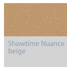
Showtime Nuance beige