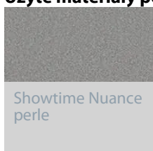
Showtime Nuance perle