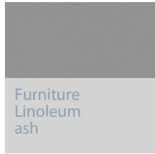
Furniture Linoleum ash