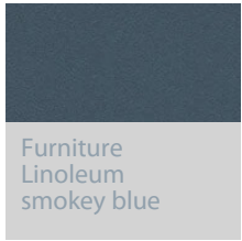
Furniture Linoleum smokey blue