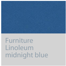
Furniture Linoleum midnight blue