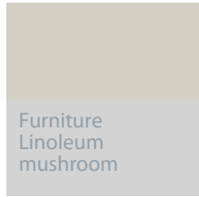
Furniture Linoleum mushroom