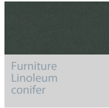
Furniture Linoleum conifer