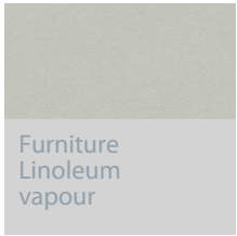
Furniture Linoleum vapour