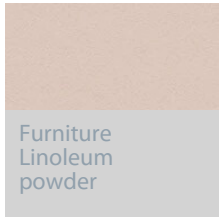
Furniture Linoleum powder