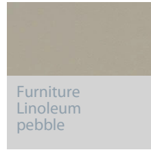
Furniture Linoleum pebble