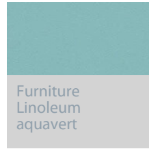
Furniture Linoleum aquavert