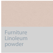
Furniture Linoleum powder