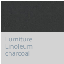
Furniture Linoleum charcoal