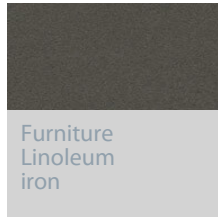
Furniture Linoleum iron