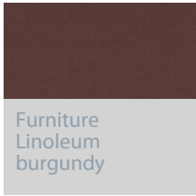
Furniture Linoleum burgundy