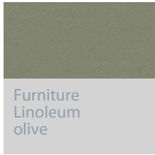
Furniture Linoleum olive