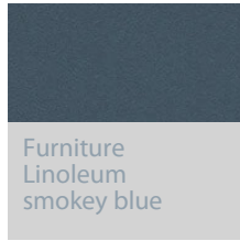
Furniture Linoleum smokey blue