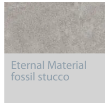
Eternal Material fossil stucco