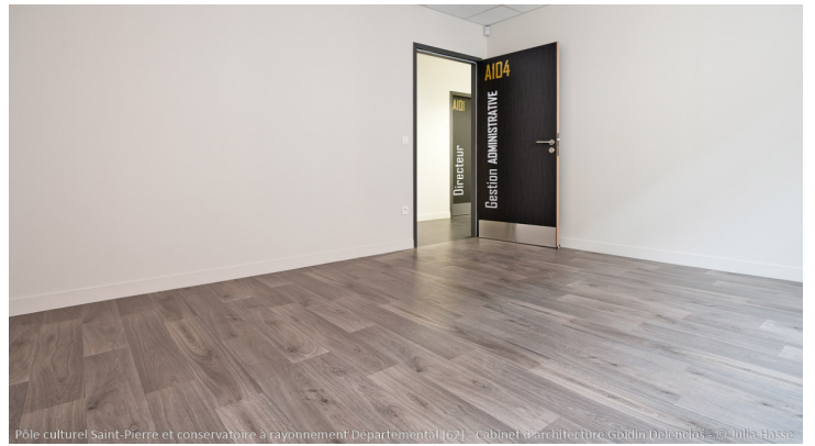
Pôle culturel Saint-Pierre et conservatoire à rayonnement Départemental (62) - Cabinet d'architecture Goidin Delenclos