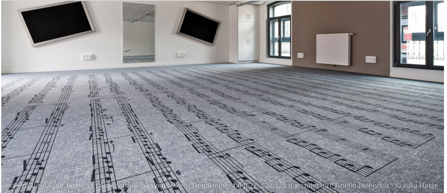
Pôle culturel Saint-Pierre et conservatoire à rayonnement Départemental (62) - Cabinet d'architecture Goidin-Delenclos

The academy of music in Arras is – with 770 students - the bigger institution of this kind in Pas-de-Calais. For its renovation, the academy wanted to play the originality card by choosing for Flotex Lab with an artistic note. The floor is very representative for the cultural influence of the academy.