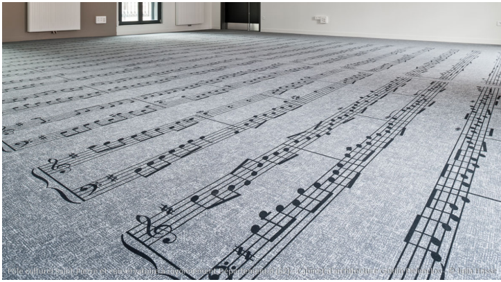
Pôle culturel Saint-Pierre et conservatoire à rayonnement Départemental (62) - Cabinet d'architecture Goidin Delenclos