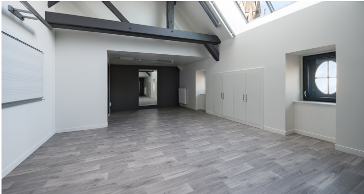
Pôle culturel Saint-Pierre et conservatoire à rayonnement Départemental (62) - Cabinet d'architecture Goidin Delenclos