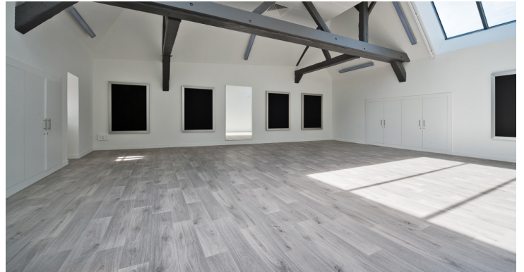
Pôle culturel Saint-Pierre et conservatoire à rayonnement Départemental (62) - Cabinet d'architecture Goidin Delenclos