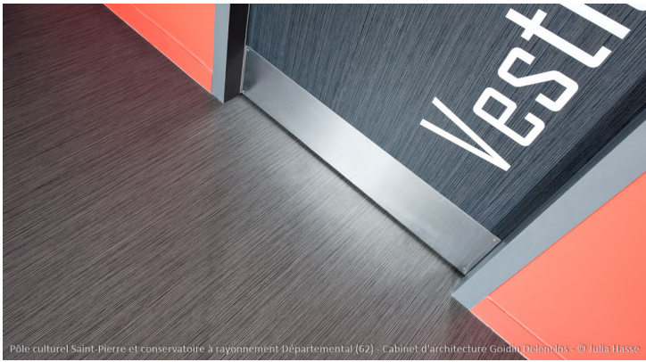
Pôle culturel Saint-Pierre et conservatoire à rayonnement Départemental (62) - Cabinet d'architecture Goidin Delenclos