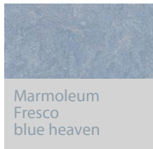
Marmoleum Fresco blue heaven