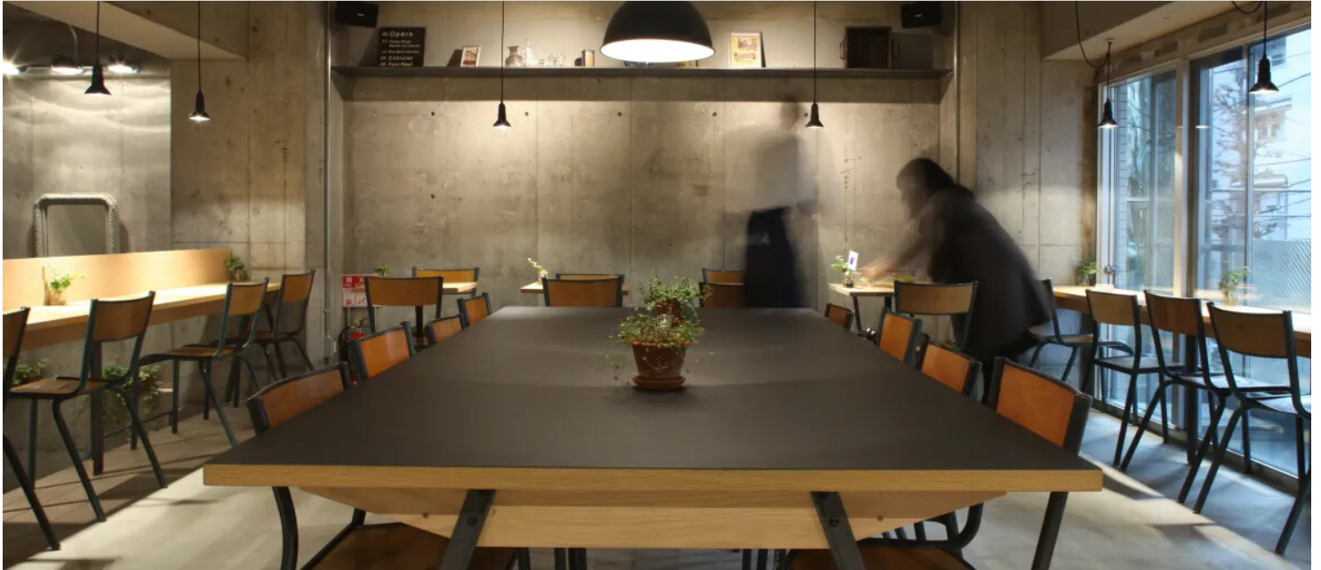
CITRON Bar A Salades Parisien酒吧

工程地点 Minato-Ku, Tokyo 建筑设计 KEIJI ASHIZAWA DESIGN 安装公司 Ishinomaki Laboratory