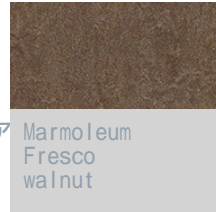
Marmoleum Fresco walnut