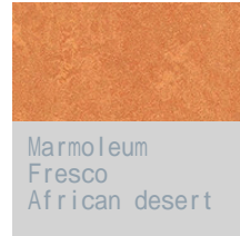
Marmoleum Fresco African desert