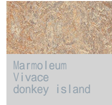
Marmoleum Vivace donkey island