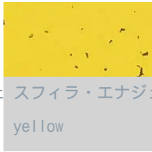
スフィラ・エナジェティック yellow